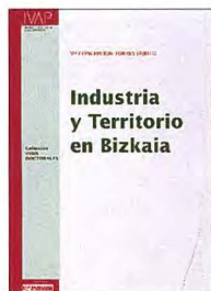
Colección Tesis Doctorales. Instituto Vasco de Administración Pública. (IVAP), 1995.