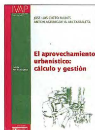
Serie Urbanismo. Instituto Vasco de Administración Pública. (IVAP), 1995.